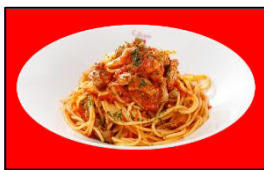
鳥取和牛をじっくり煮込んだトマトソースのスパゲッティ 1,680円