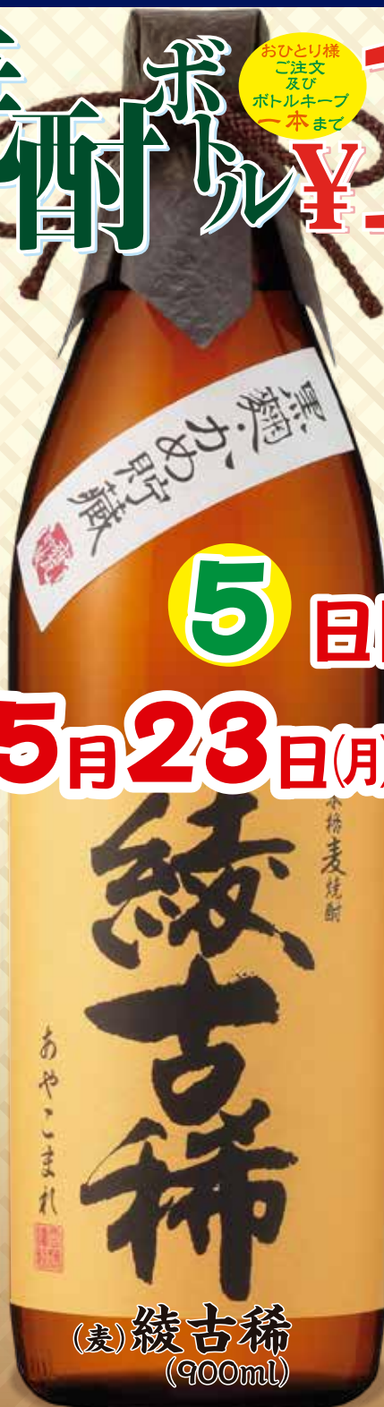
(麦) 綾古稀 (900ml)