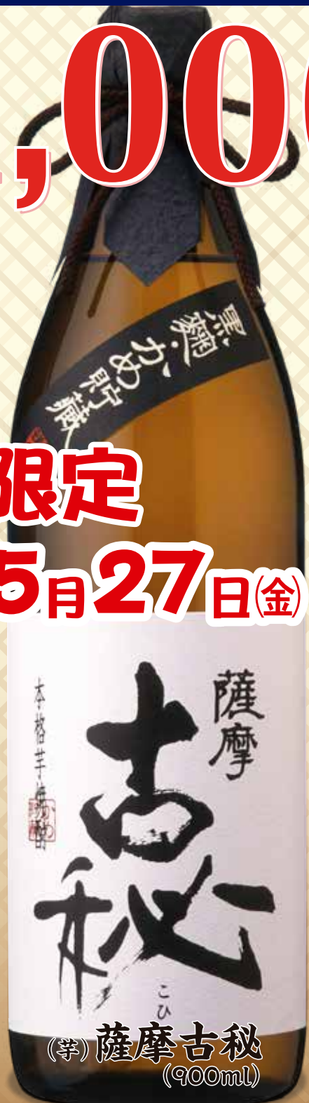
(芋) 薩摩古秘 (900ml)